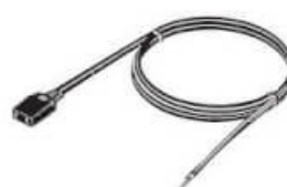
Plug Cord (1 m)